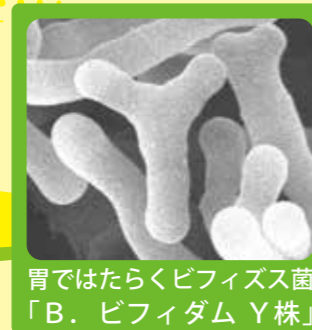
胃ではたらくビフィズス菌 「B. ビフィダム Y株」